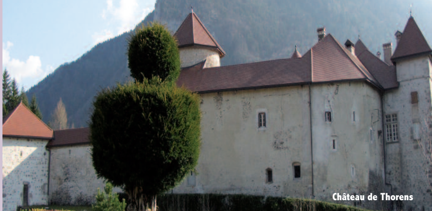
Château de Thorens